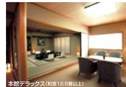
本館デラックス(和室12.5畳以上)