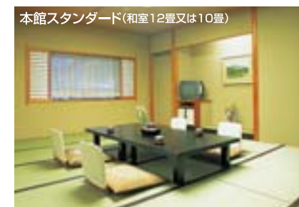
本館スタンダード(和室12畳又は10畳)