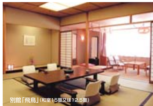
別館「飛鳥」(和室15畳又は12.5畳)