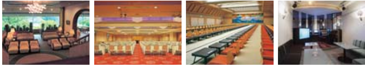
レストラン&ラウンジ けやき